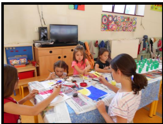
Voici quelques photos des activités de Tellancourt :