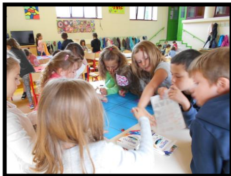
Quelques photos de Tellancourt :