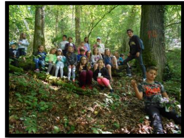
Quelques photos de Cons :